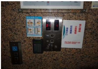
張貼節約能源標語(1)