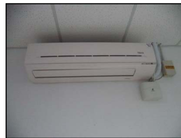
圖 5、汰換老舊高耗能窗型冷氣為分離式冷氣，並導入能資源智慧管理系統，搭配課表控制、卸載管控及停機排程功能