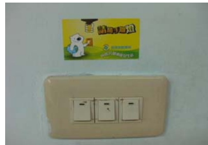
張貼節約能源標語(2)

備註：其他節約能源相關作法可參考「政府機關及學校節約能源行動計畫」( https://egov.ftis.org.tw/download?cno=2 )。